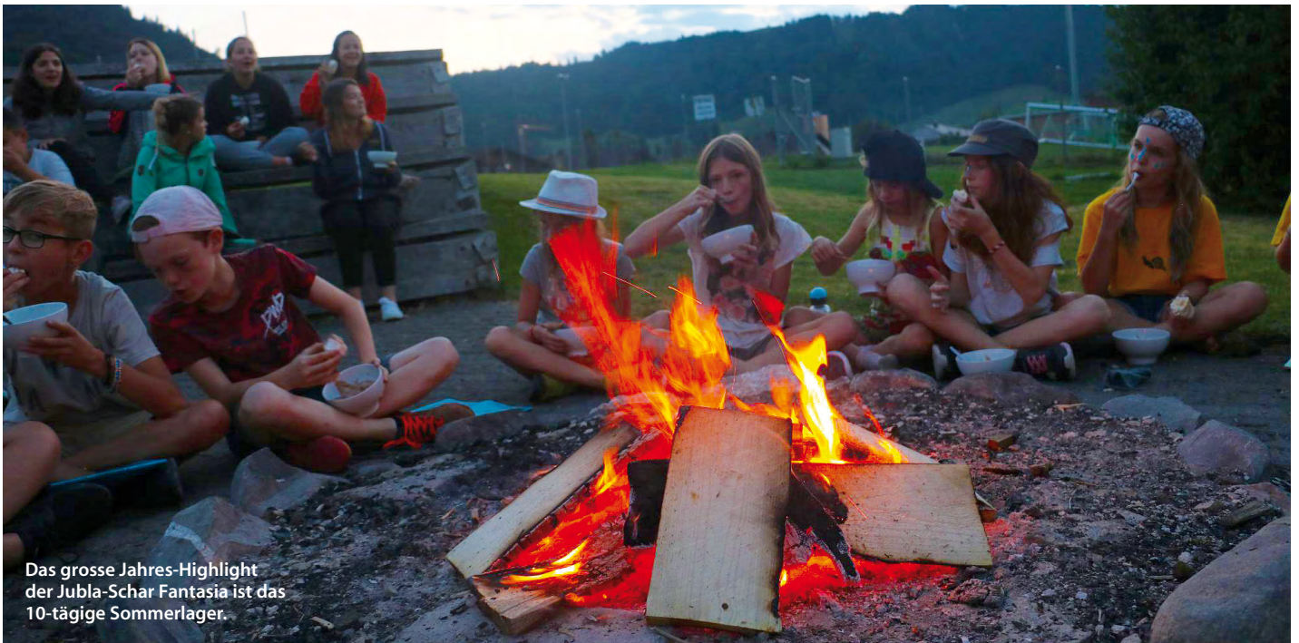
Das grosse Jahres-Highlight der Jubla-Schar Fantasia ist das 10-tägige Sommerlager.